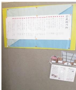
前回の展示の様子

次回のテーマは 「お正月」です。ユニークな作品をお待ちしています。 12 月 20 日締切