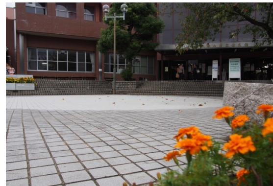
公民館前に広いスペースができました